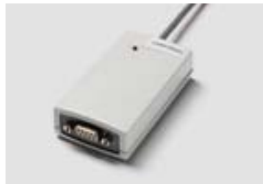
Seriell Interface (RS 232) zur unterstützenden Steuerung mit Memoryfunktion