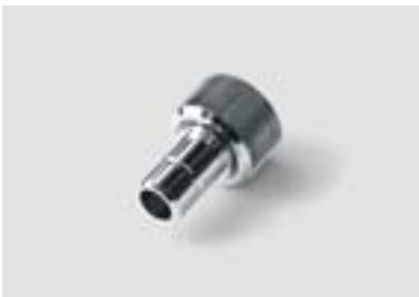
Adapter für Schott Lichtleiter